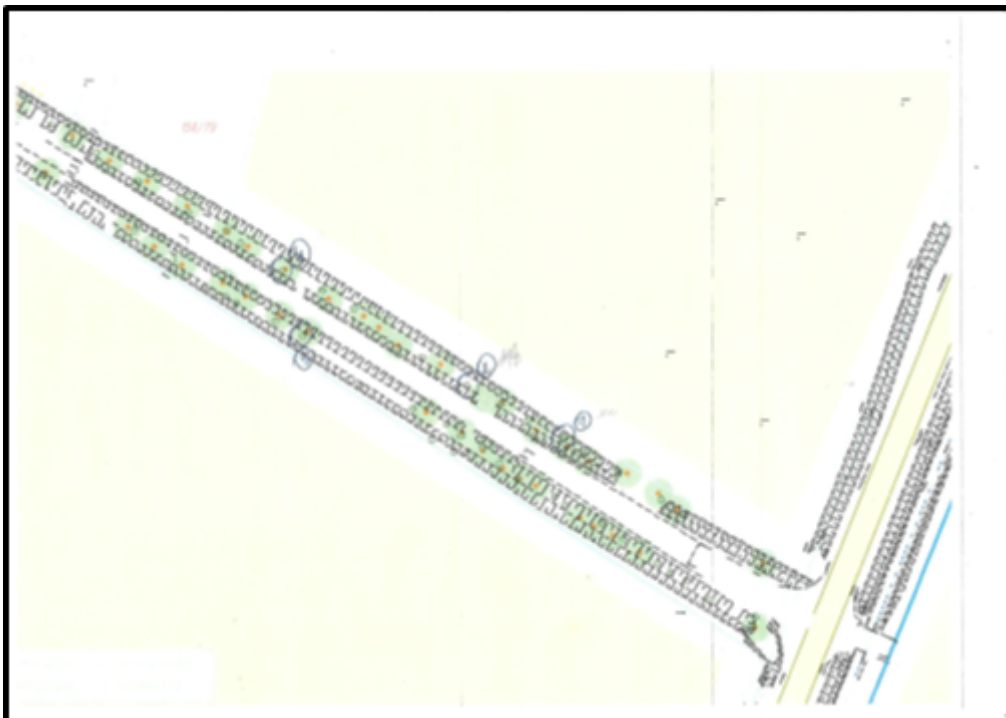
Usytuowanie drzew nr 5, 6, 7, 8, 9, 10, 11