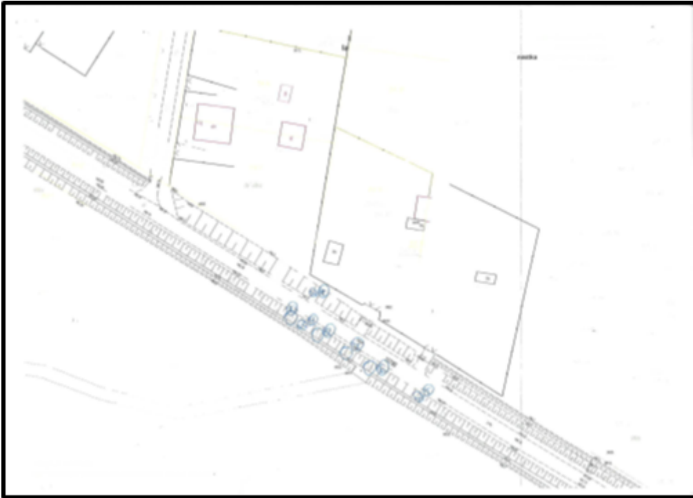
Usytuowanie drzewa nr 12